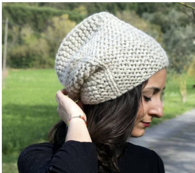
Bouillon può essere indossato anche con la "cresta" centrale alzata

Lav i ferri 7 & 8 finché restano solo 9 m.